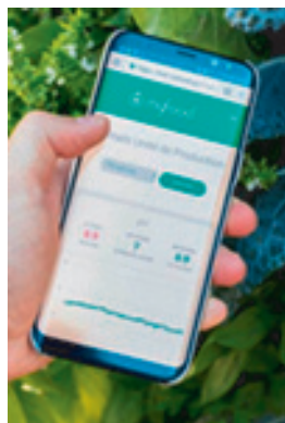
L'application Myfoodhub connectée au boîtier intelligent

Le boîtier intelligent collecte les paramètres utiles au contrôle de la serre : l'acidité, la température de l'eau tout comme la géolocalisation de la serre. Ces données sont stockées dans l'informatique en nuage ( cloud computing ) afin d'être accessibles à l'équipe d'agronomes qui assure un suivi précis de tous les « Pionniers ». Elles alimentent un outil d'intelligence artificielle dont l'objectif est de produire des recommandations pour les « Pionniers » ainsi que d'assurer une surveillance automatisée des serres. Avec le temps, les préconisations s'affinent et permettent une meilleure utilisation des serres au quotidien.