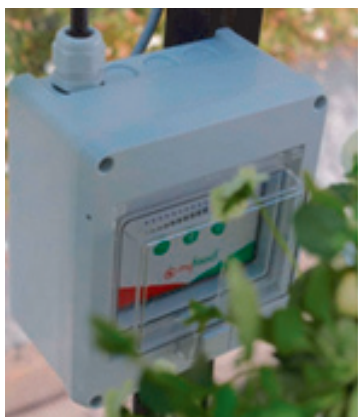
Un boîtier intelligent installé dans une serre